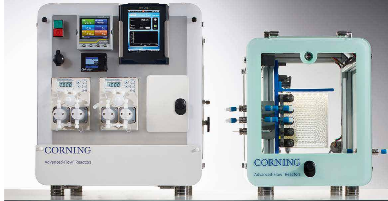
サイズ: 45 × 48 × 52 cm (奥行×幅×高さ)