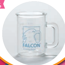
Falcon ハンドル付き ビーカー