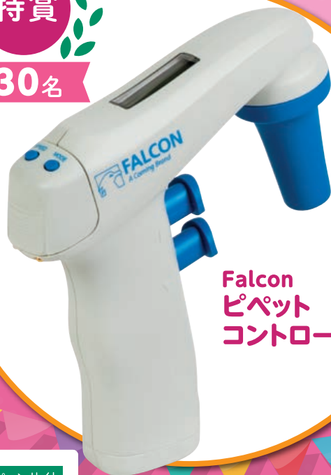
Falcon ピペット コントローラー