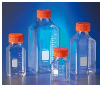
Corning 角型ストレージボトル (PET製)

注意 2: オートクレーブ処理の際はキャップを本体ボトルから完全に外してください。