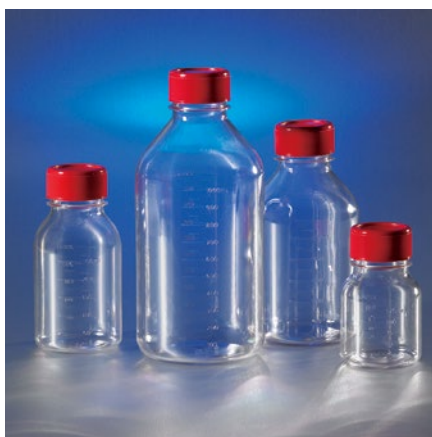
Costar ストレージボトル (PS 製)