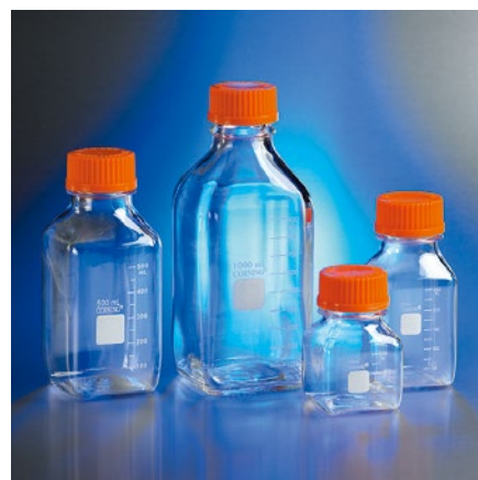
Corning 角型ストレージボトル (PC 製)