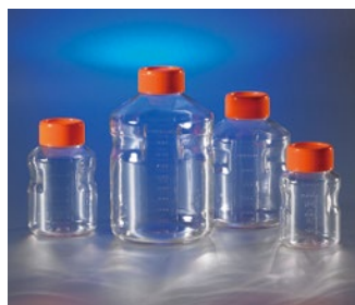
Corning イージーグリップ型 ストレージボトル (PS製)