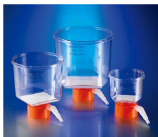
ボトルトップフィルター