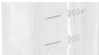
成型目盛りでより正確な容量の読み取りが可能