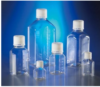
八角型ストレージボトル (PET製)