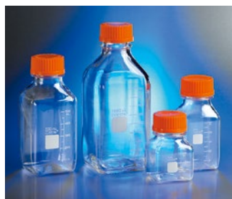
角型ストレージボトル (PC製)