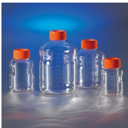
Corning イージーグリップ型 ストレージボトル (PS 製)