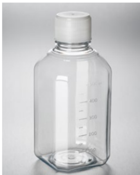
500 mL 培地ボトル PET 製 (カタログ番号 432333)

注意：八角型ボトルをボトルトップフィルターと組合わせて陰圧をかけて使うと、形状的に圧力が不均等にかかるので破損する恐れがあります。そのような用途では使用しないでください。