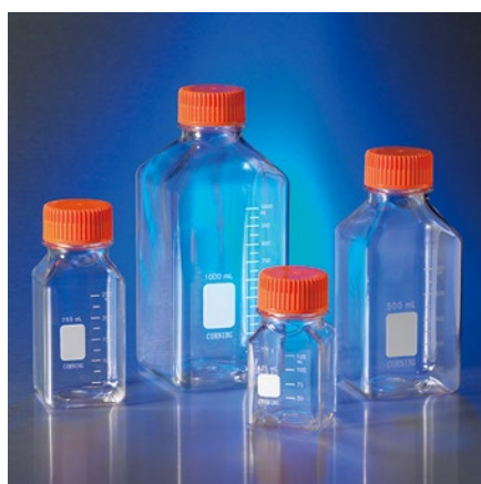
Corning 角型ストレージボトル (PET 製)

* 冷凍使用でのボトルの性能は温度とボトルの中身によります。実際の条件下で、凍結保存時のボトルの安定性確認のための性能試験をされることをお勧めします。