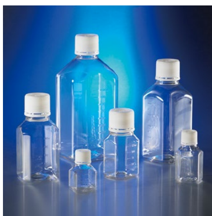
Corning 八角型ストレージボトル (PET 製)