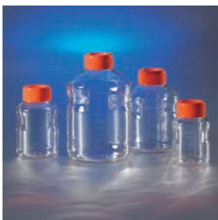
Corning イージーグリップ型 ストレージボトル (PS 製)