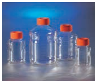
Corning イージーグリップ型 ストレージボトル (PS製)