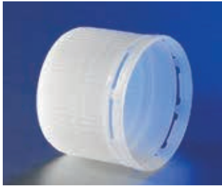
タンパータイプのスクリューキャップ