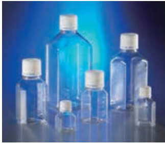
八角型ストレージボトル (PET製)