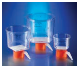
ボトルトップフィルター