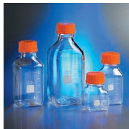
Corning 角型ストレージボトル (PC 製)