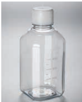
500 mL 培地ボトル PET 製 (カタログ番号 432333)

注意：八角型ボトルをボトルトップフィルターと組合わせて陰圧をかけて使うと、形状的に圧力が不均等にかかるので破損する恐れがあります。そのような用途では使用しないでください。