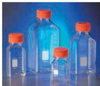
Corning 角型ストレージボトル (PET製)

注意 2：オートクレーブ処理の際はキャップを本体ボトルから完全に外してください。