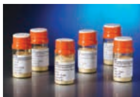
Corning マイクロキャリア 10 g バイアル