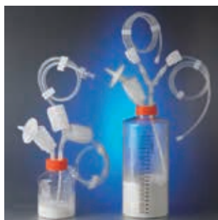
滅菌トランスファーキャップを 装着した 100 g と 500 g の ボトル

Corning CellBIND、低濃度 Synthemax II と無処理マイクロキャリアは、バイオリアクターに送液する際に偶発的に発生するコンタミネーションを回避できるコーニングの滅菌トランスファーキャップが使用可能な 100 g と 500 g ボトルで提供しています。トランスファーキャップは、オスルアーロッククイックコネクター、または MPC クイックコネクターから選択できます。マイクロキャリアと滅菌トランスファーキャップは別々に販売しています。