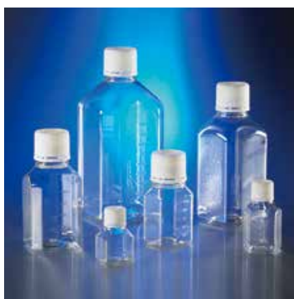
Corning 八角型ストレージボトル (PET 製)