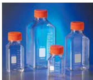
Corning 角型ストレージボトル (PET製)