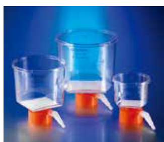
ボトルトップフィルター