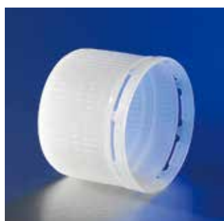
タンパータイプのスクリューキャップ

注意：八角型ボトルをボトルトップフィルターと組合わせて陰圧をかけて使うと、形状的に圧力が不均等にかかるので破損する恐れがあります。そのような用途では使用しないでください。