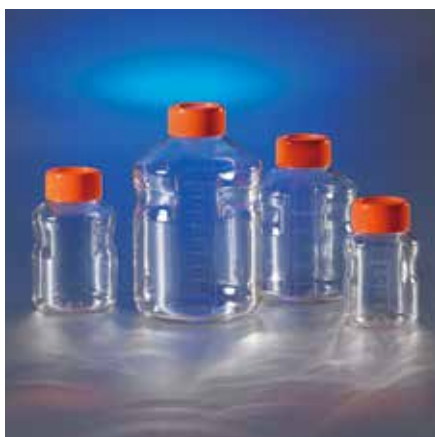
Corning イージーグリップ型 ストレージボトル (PS 製)