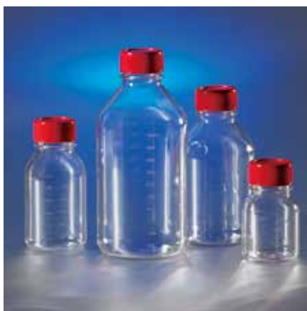
Costar ストレージボトル (PS 製)