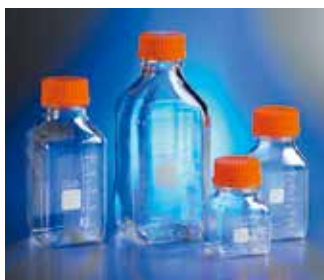
角型ストレージボトル (PC製)