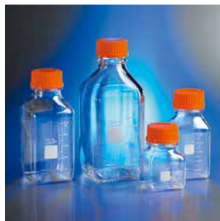
Corning 角型ストレージボトル (PC 製)