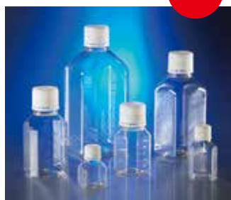
成型目盛りでより正確な計量が可能