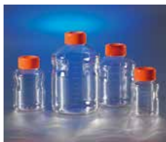
Corning イージーグリップ型 ストレージボトル (PS製)