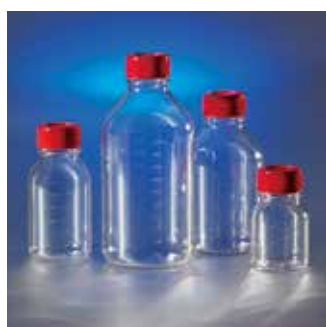
Costar ストレージボトル (PS製)