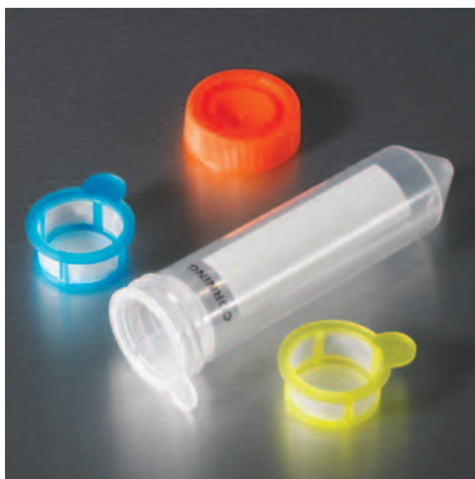
メッシュサイズを色別で示しています。 (青；40 \mu m、白；70 \mu m、黄；100 \mu m)