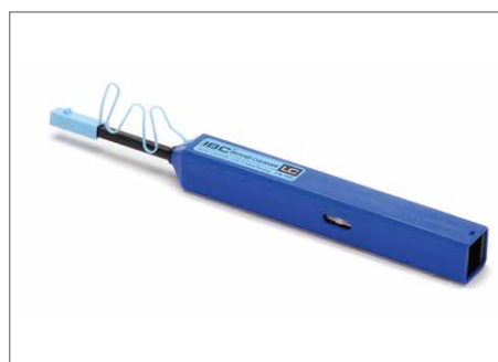
单根光纤接头清洁工具1.25mm连接器

康宁的单根光纤接头清洁工具专为有效清洁插线面板与适配器中的连接器端面所设计。完整的防尘帽可用于清洗未配对的连接器端面。可有效去除以下物质：肌肤油脂、护手霜、尘埃、石墨、盐、异丙醇残渣与蒸馏水残留。这些清洁工具易于使用，至少可清洁525次。