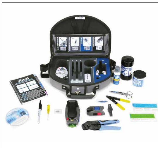
UniCam 高性能安装工具套件