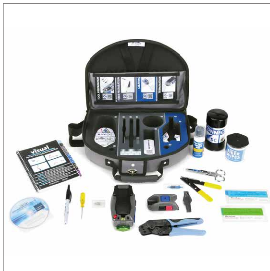
UniCam高性能安装工具套件