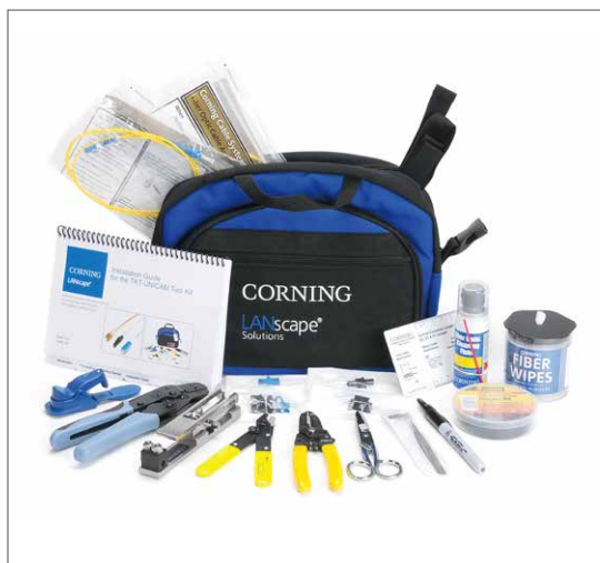
UniCam接头Standard安装工具套件