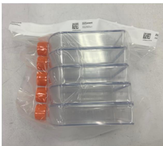
変更後パック包装