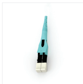
Connecteur LC Duplex Uniboot