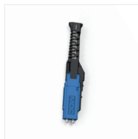
Connecteur MDC Senior