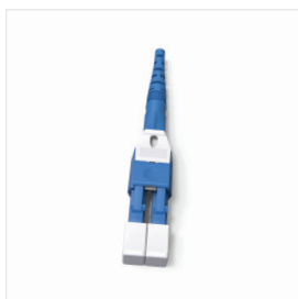
Connecteur LC Duplex Uniboot verrouillable

6) Pour les connecteurs MDC et SN, 1,6 mm est le diamètre de câble par défaut et recommandé.