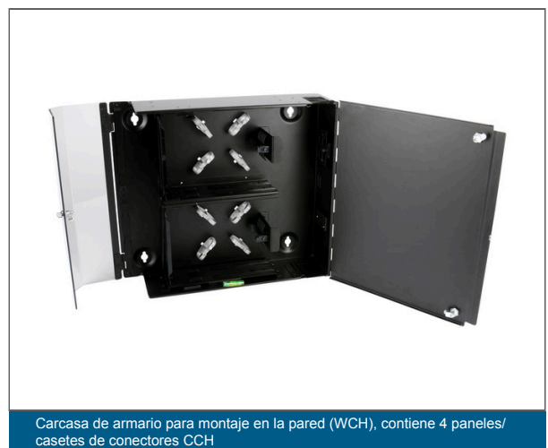
Carcasa de armario para montaje en la pared (WCH), contiene 4 paneles/casetes de conectores CCH