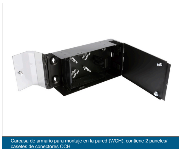
Carcasa de armario para montaje en la pared (WCH), contiene 2 paneles/casetes de conectores CCH