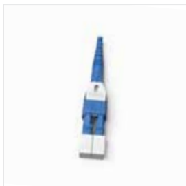
LC Duplex Uniboot mit Verriegelung

6) Für MDC und SN Stecker ist 1,6 mm der Standard- und empfohlene Kabeldurchmesser.