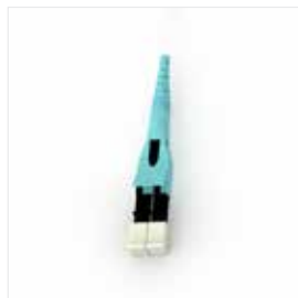
LC Duplex Uniboot