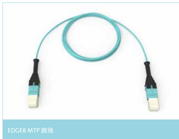
EDGE8 MTP 跳线

在与EDGE8®含导向针的主干光缆一起使用时，EDGE8 8芯MTP® 跳线将使数据传输能够无缝迁移至更高的数据速率。