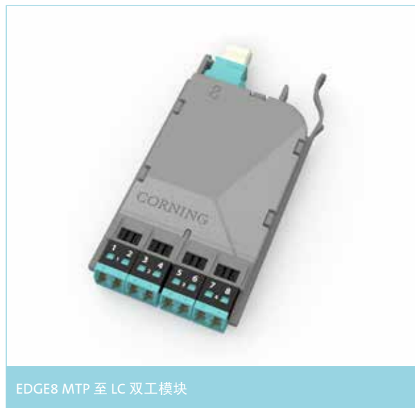
EDGE8 MTP 至 LC 双工模块

EDGE8® 模块提供了 8 光纤 MTP® 连接器和 LC 双工连接器之间的接口。