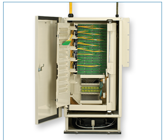
OptiText Indoor Gen III Cabinet (open) | Photo CCO120