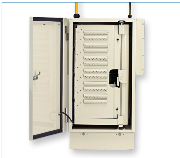
OptiText Indoor Gen III Cabinet - Parking Panel | Photo CCO118

The Gen III Indoor cabinet also features an innovative swing-out panel for rear connector access and an integrated storage door for parking unused splitter module output connectors.