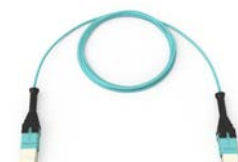
EDGE 12 芯 MTP 到 MTP 跳线 J757512QEZ-NBxxxM