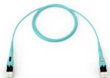
EDGE 可转换极性双工 LC 集成式联合尾套跳线 E797902QNZ20xxxM (xxx = 分支到 MTP 光缆长度)