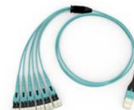
EDGE 分支跳线 H937912QLZ-JAxxxM (xxx = 跳线长度)