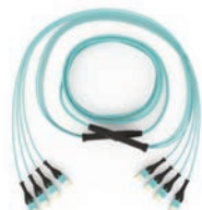
主干光缆 G7575yyQLZ88UxxxM (yy = 光纤芯数, xxx = 光缆长度)